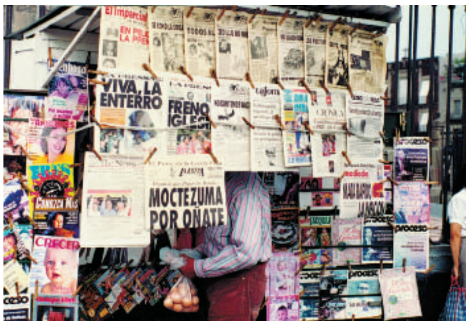
La oferta periodística cubre a los distintos perfiles de lectores.

El lenguaje del periódico se compone de varios elementos. Primeramente encontra-