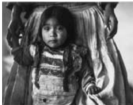
Aumentó el índice de desnutrición infantil en 1996.