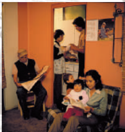
El periódico, un medio cotidiano de información.

Cuando la información es relevante para su vida cotidiana, el joven y el niño participan con más interés. Las matemáticas y la información científica, por ejemplo, cobran vida cuando los alumnos trabajan con avisos de ocasión , anuncios, secciones sociales, deportivas y culturales. El periódico, visto así, ofrece referen-