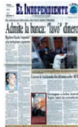
El periódico en México: una fuerte tradición.

La historia del periodismo escolar es más antigua que el actual interés por utilizar la prensa en el salón de clases, sin embargo sigue siendo un medio de expresión privilegiado. El periódico escolar facilita el conocimiento de la prensa desde dentro: la organización necesaria para crearlo, los problemas que enfrenta, los límites que impone el medio (tiempo, espacio, pertinencia, importancia, etcétera). Los alumnos y el maestro deberán definir el carácter de su periódico (información de la comunidad, exposición de trabajos de investigación y literarios, de temas científicos o por época histórica) así como definir la forma de impresión